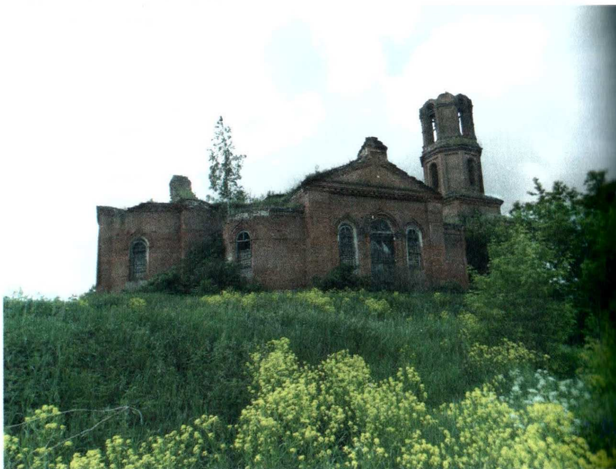
2012 г. Церковь Космы и Дамиана

В силу своей работы часто приходится ездить по селам своего района. Больше всего меня впечатлила заброшенная церковь с. Озерки. Стоит старинная красавица, свидетельница былых времен, теперь с грустью взирающая своими пустыми глазницами на село. Церковь Космы и Дамиана построена приблизительно 1870 - 1915 гг. взамен устаревшей. Местные жители рассказывали, что где то в густых зарослях есть надгробие. Но мы его так и не смогли найти, все очень сильно заросло. Самое удивительное сохранились двери и на них висит пудовый замок, окна заколочены. Это говорит о том что за ней еще кто-то присматривает, и спасает от вандалов.