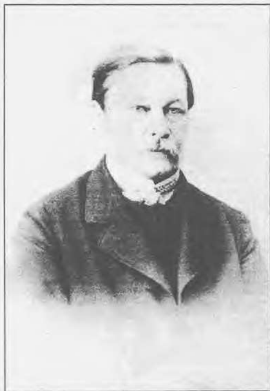
Константин Николаевич Смолянинов 1820 – 1872