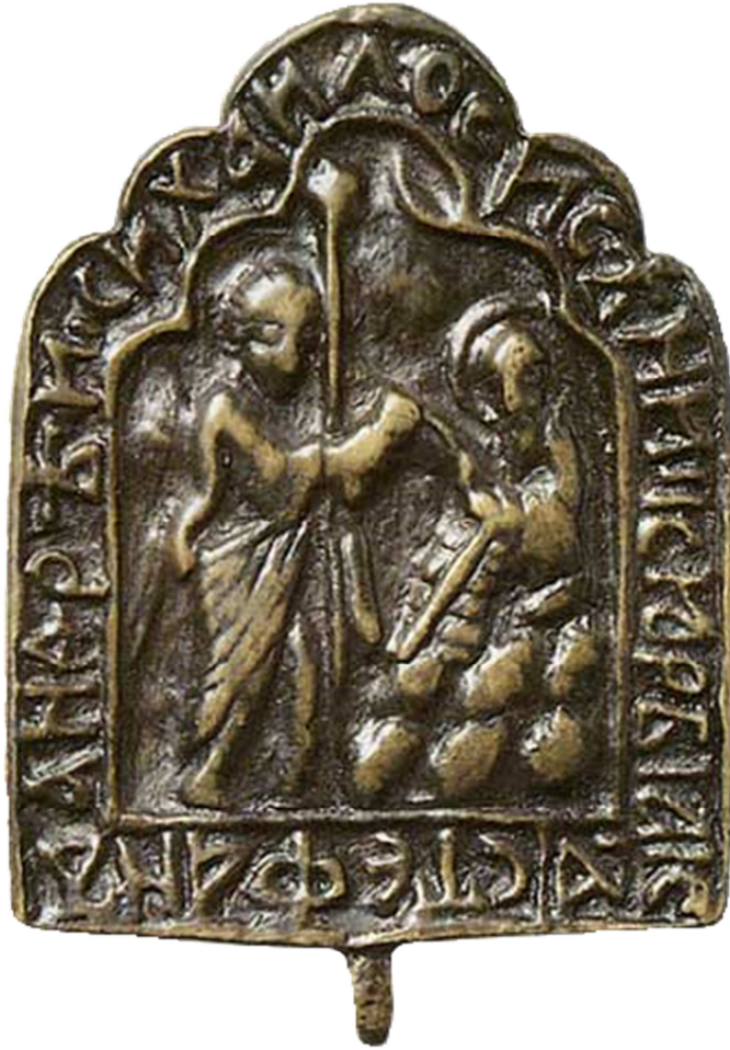
Рис. 2 Створка иконы-энколпия «Архангел Сихаил перед святым Сисинием», XIVв., Москва, Музей им.Рублева( масштаб не указан).