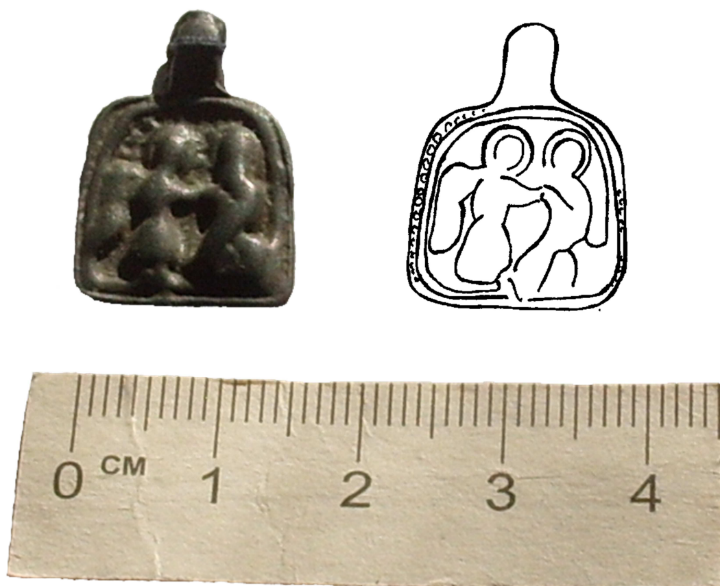
Рис.1 Нательная иконка «Архангел Сихаил перед святым Сисинием», конец XIV в., Кораблинский краеведческий музей.